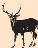
Red & Fallow Hjort