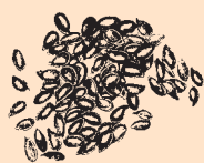
Britisk dyrket Hørfrø