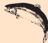
Skotsk Atlanterhavs Laks